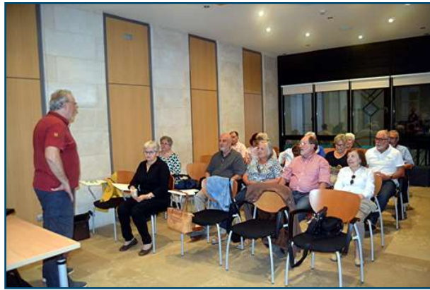
Un moment de la tertúlia a Can Alcover.