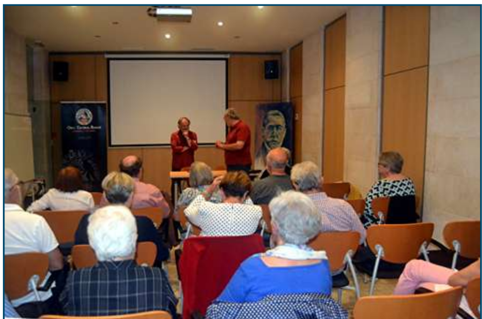
Un altre moment de la tertúlia a Can Alcover.

En aquests moments, segons en Jaume, el que ens uneix a les illes del nostre arxipèlag, a més d'una mateixa llengua i cultura i en contra del que semblaria lògic en temps de recuperació econòmica, són els efectes devastadors del turisme i una demolidora discriminació econòmica per part de l'estat que provoca feina precària, mal pagada i totalment insegura. Aquests condicionants, units a una falta total de control dels recursos dels aeroports, ports, contractació turística, cotxes de lloguer, etc., etc., en un escenari que contempla pel 2017 una afluència de vint-i-sis milions de turistes (26.000.000), que suportam sense percebre el gruix dels beneficis, fa palesa la necessitat imperiosa de començar a parlar de formes de sobiranisme o moviments sobiranistes. En contraposició a la situació actual: Estat i després comunitat autònoma i poble, anteposar primer poble o nació i després l'estat i revertir d'una vegada aquesta situació insostenible que patim a les nostres illes.