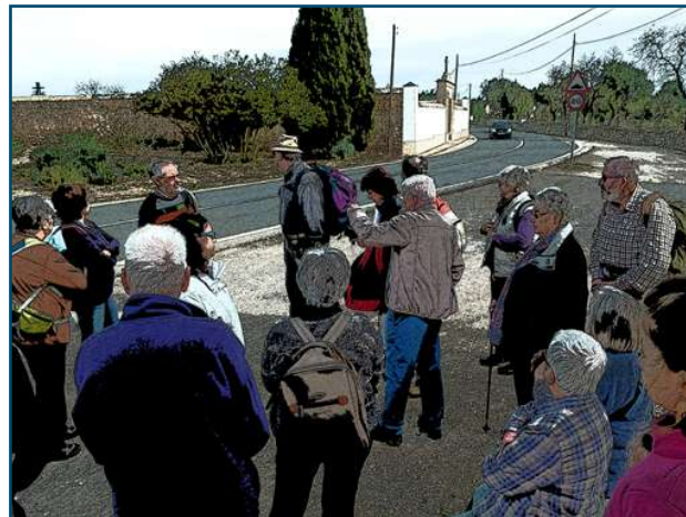
Tants varen venir, que fou impossible saber quans eren!

Però si, feia calor, com que fa tant de temps que no plou els camins són ressecs i, som tants que aixecam una polseguera que es veu des de Raixa, patim de no cridar massa l'atenció i provocar que vinguin les assistències, els municipals o la protecció civil, val més tornar.