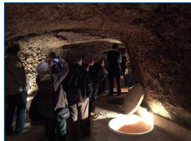
Les galeries subterrànies de la bodega.

A la tarda, després de descansar un poc, agafarem el bus i circularem per aquesta terra tan bella com, almenys per a nosaltres, desconeguda, entre les comarques de la Vall d'Albaida i La Costera (la Toscana valenciana li diuen), l'objectiu fou visitar una bodega singular, El Celler del Roure. Aquest celler es troba a les Terres dels Alforins,