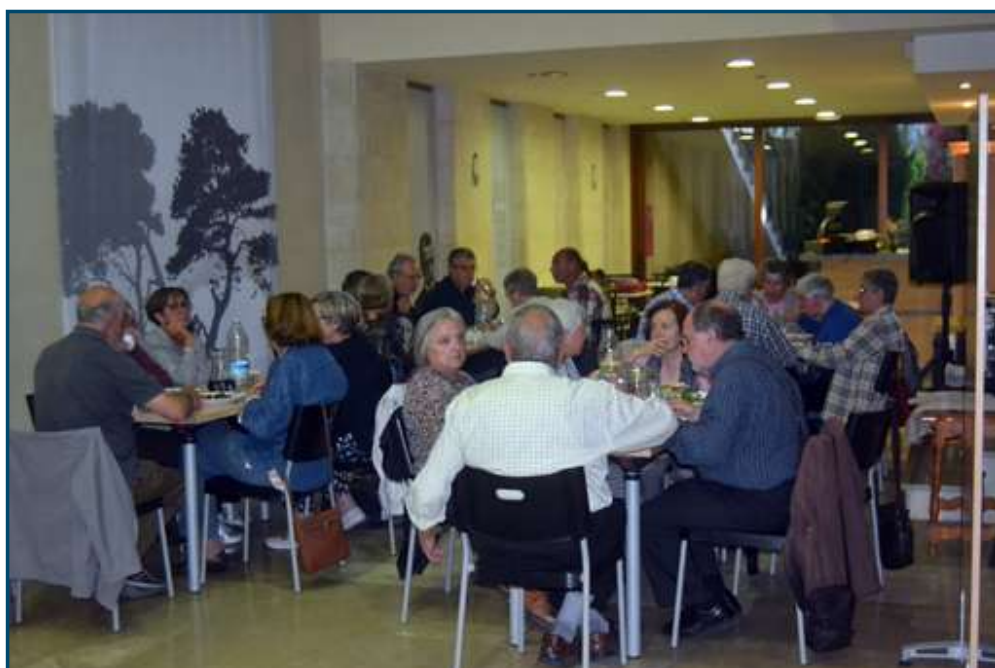
Com sempre, abans de la tertúlia sopam el pa amb olí que ens prepara n'Antònia.

Avui, aquest senzill gest s'ha transformat en la iniciativa global més gran de mobilització pel medi ambient, milers de ciutats de més de 180 països i centenars de milions de ciutadans s'uneixen durant aquest espai de temps per fer front al repte ambiental més gran del nostre segle, doncs "l'Hora del Planeta" va néixer com a resposta a la pressió de la indústria dels combustibles fòssils i a la inacció dels Governos involucrats, incapaços de comprometre's amb un acord global per reduir les emissions de gasos contaminants. Dues imatges nocturnes de la nostra Seu, una il·luminada i l'altra amb els llums apagats, van servir molt gràficament per a visualitzar l'efectivitat d'aquesta mesura. Però entrem en matèria, la contaminació lumínica es caracteritza bàsicament per l'augment del fons de lluentor del cel nocturn a