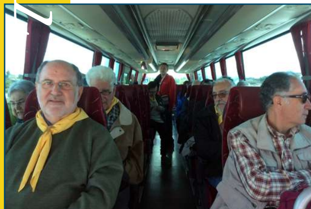
Embarcats a bord del bus.