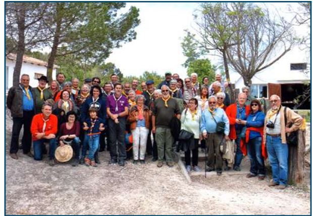
Tot el grup a la casa Oràa.

Estaven convocades les següents entitats: Fundació Josep Sans i Antics Escoltes i Guies per Catalunya, Fundació Sant Jordi de Girona, SIGAC-Scouts i Guies Adults de Catalunya, Fundació Maria Ferret de les Illes Balears, Aplec Scout, Escoltisme Adult de Mallorca i la Fundació Scout Sant Jordi de València que en foren els amfitrions. Els assistents de l'Aplec en fórem tretze –encara que dos també ho eren de la FMF– i un de la Fundació Maria Ferret, una bona representació. Ens trobarem a l'aeroport, carregats d'il·lusió, ganes de participar, compartir i enriquir-nos, a banda de la càrrega material que haguérem de facturar, ja que no cabia a les maletes de cabina.