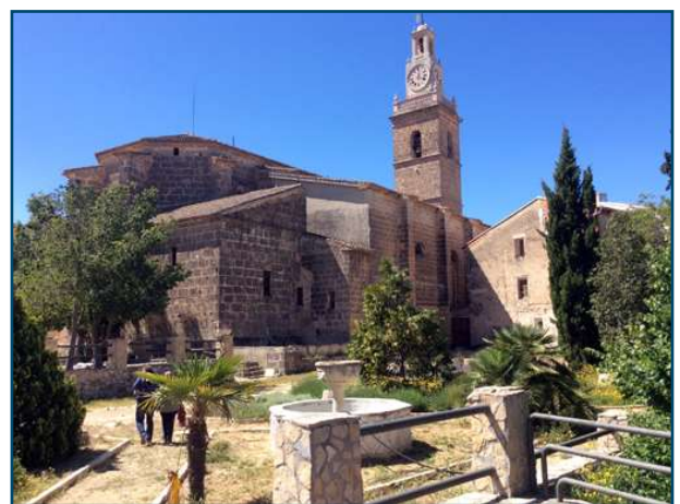
Vista posterior del Palau dels Milà i Aragó.

Tot seguit, a migdia, se celebra una Missa Cantada. Després, dinàrem al mateix local del dia anterior d'un arròs al forn, així fou el final de la trobada, tots en cercle i agafats de les mans ens acomiadàrem entonant el cant de l'alegre Adéu Siau.