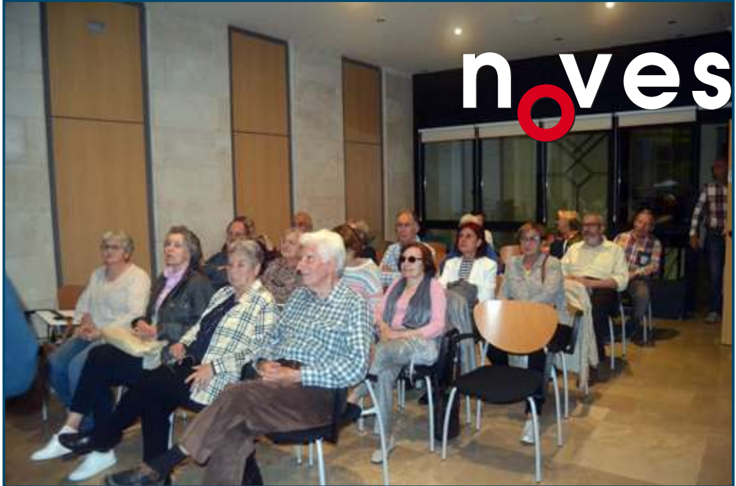
Un moment de la tertúlia a Can Alcover.