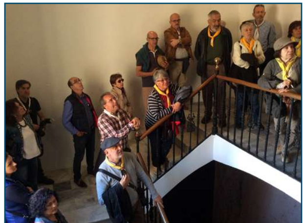
Els participants atenent les explicacions de la guia.

creada pels hereus d'aquest pintor a la casa on residia i tenia el seu estudi, la casa va ser dissenyada i construïda per ell mateix en 1943. Tota la decoració amb motius àrabs de gran part de la casa, és idea del pintor i roman igual que quan ell vivia, hi ha més de 150 obres originals del pintor, a destacar entre elles, il·lustracions per novel·les de Vicent Blasco Ibáñez, per als contes de Les mil i una nits, per El Quixot i la seva obra pòstuma La Pentecosta. També és important la biblioteca amb uns 11.000 exemplars.