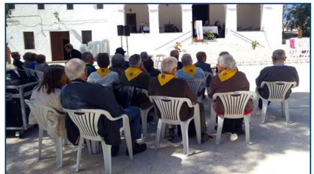
Esperant el començament de la missa.

Dilluns 24: Ens vengueren a recollir a l'hotel d'Aielo per anar a l'Ermida de Sant Vicent d'Agullent, on tot el poble, les bandes Mora i Cristiana i la comissió festera pugen en romeria en honor del sant Patró. Durant tot el recorregut i per part dels dos bàndols dispararen sense descans eixordadors trets d'arcabuseria, acaba la comitiva un pas amb la imatge de Sant Vicent portada per representants dels festers seguida per la banda de música.