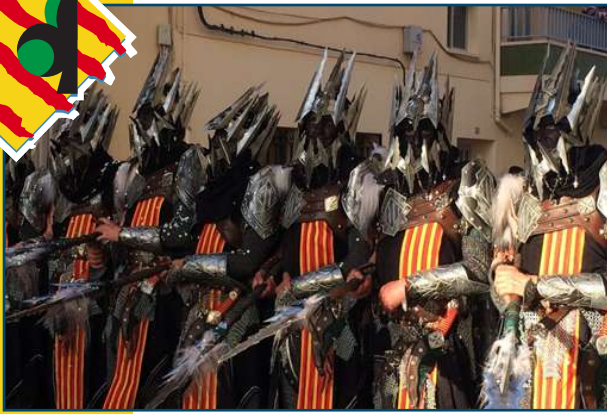
Filà de cristians (entrada d'Agullent).