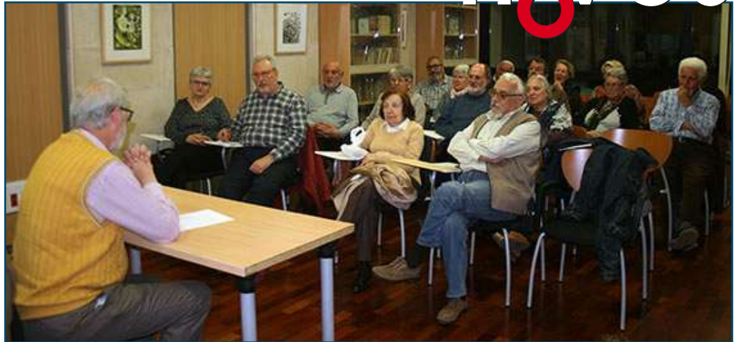
Un moment de la tertúlia a Can Alcover.