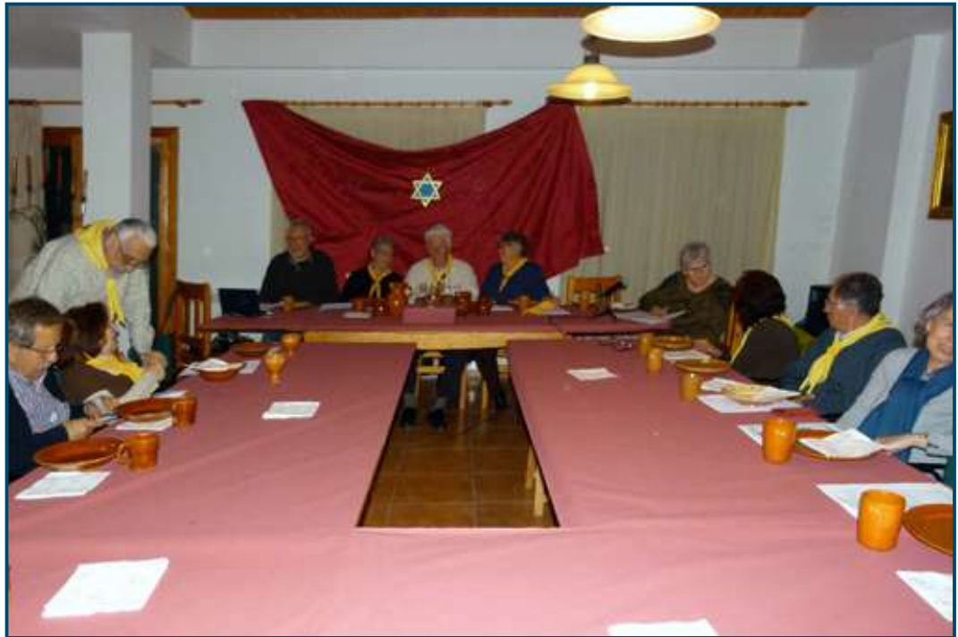
La taula de Pasqua a l'antiga rectoria de Bunyola.