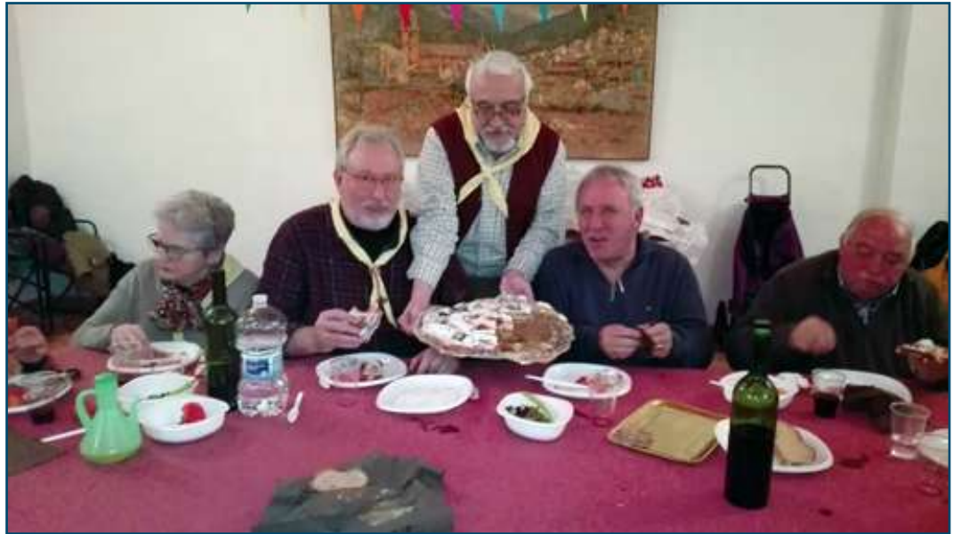
L'hora de les postres.

en el campament Edith Macy (Avui Edith Macy Conference Center New York) de l'associació de Guies Scouts dels U. E. A.