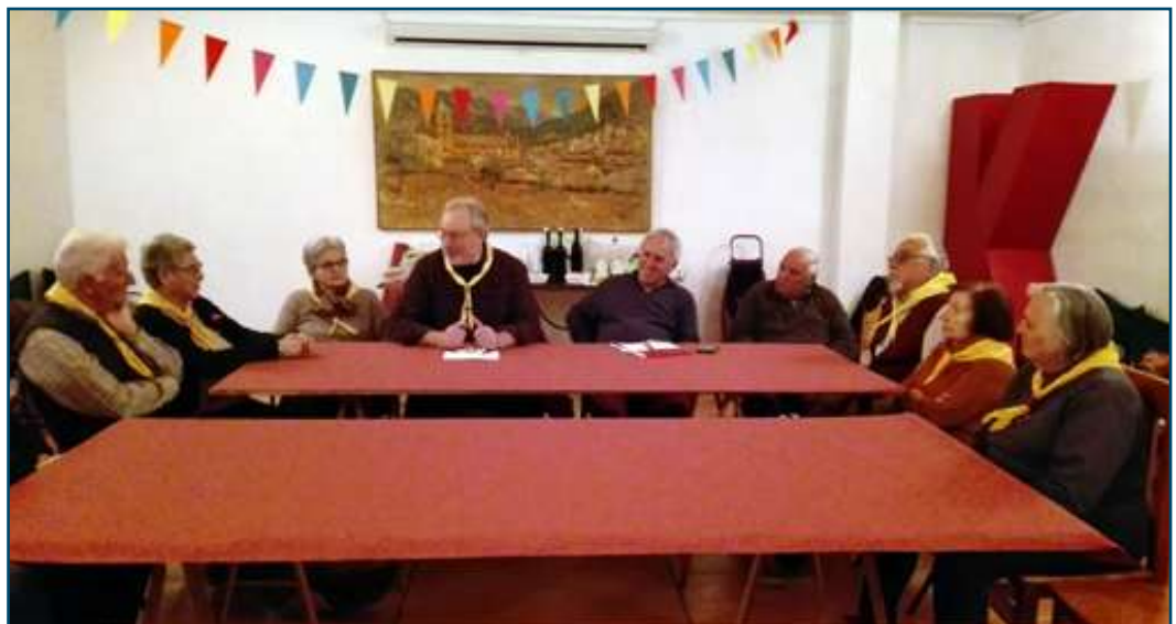
Un moment del debat a la sala K de l'antiga rectoria de Bunyola.

Com tots sabeu Robert Stephenson Smyth Baden-Powell, 1r Baró Baden-Powell –22 de febrer del 1857, Londres (Anglaterra) - 8 de gener del 1941, Nyeri (Kenya)–, va ser un Tinent General de l'exèrcit britànic, escriptor i, sobretot, el fundador del Moviment Escolta Mundial. Enguany és el 160è aniversari del seu naixement i, com cada any, els escoltes i les guies de tot el planeta celebren el Dia Mundial del Pensament. És un acte de reflexió en memòria del