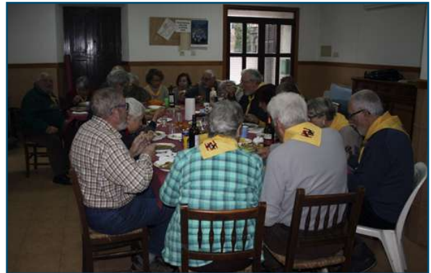
Hora de menjar el saborós arròs brut.

Com que les taules ja estaven muntades teníem mitja feina feta, ara hi anam posant plats i coberts i alguna coseta d'aperitiu, el calderó ja és al foc amb els "fondos" que tots hi aportam, uns més coents i uns més dolços, altres més salats o més fats, alguns amb caragols i altres amb conill, etc., etc. tot el necessari per fer un autèntic, saborós i nutritiu arròs brut, quan les directores d'orquestra donen el sus, s'hi tira l'arròs i com diu algú, el resultat és "l'arròs brut més brut de tots els arrossos bruts" l'oloreta que desprèn el calderó ja ens serveix d'aperitiu, les nostres pituitàries estan a tope i comença a ser irresistible l'espera, però nosaltres som gent com cal, d'ordre (l'arròs i la gana fan miracles) i, de pressa però amb ordre ens posam en fila, succs gàstrics disparats i plat en mà disposats a rebre una generosa ració del producte estrella fruit de la tècnica i art culinària, la germanor i la cooperació dels escoltes adults... sempre a punt! I ara sense re-tin-tin, va ser ben bo,