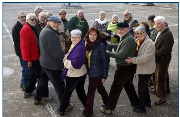
L'hora dels adéus.