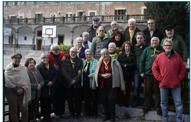
Tradicional foto de grup de l'assemblea.

Com és natural la sobretaula fou ben animada, ajudaven als ànims el bon menjar i el bon vinet que, naturalment, no va faltar, ara toca deixar la sala com si no hi hagués passat res, taules plegades i a lloc, tot escurat i fregat, equipatges als cotxes i... què fa falta? És clar, falta la clàssica foto de grup i el cant dels adéus, en cercle i agafats de les mans ens acomiadam fin a una altra trobada.