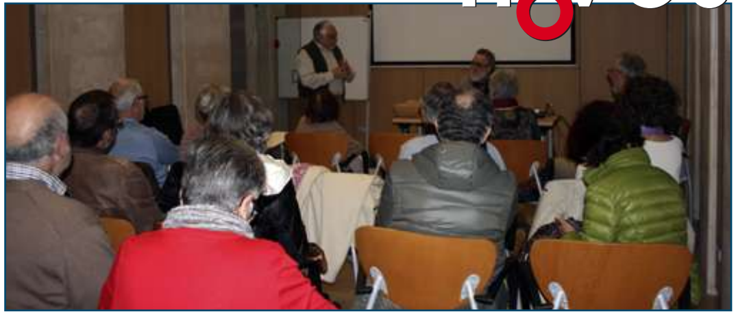
Un moment de la tertúlia a Can Alcover.