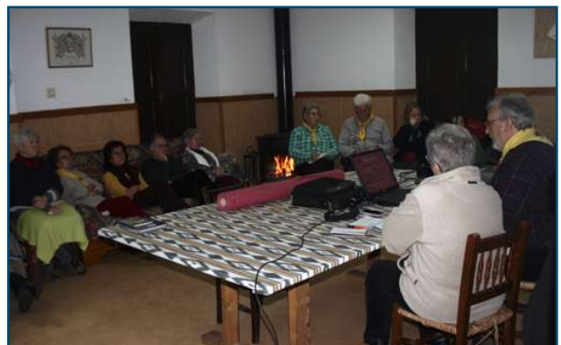
Un moment de l'assemblea a la sala de pares.

Diumenge al matí, a la mateixa sala hi va haver un bon berenar, xocolata amb ensaïmada, l'ensaïmada del Fonet de la Soca, el propietari del forn va ser el convidat a la darrera tertúlia i havíem de provar el seu producte, férem temps xerrant un poc amb els companys que anaven pujant i preparant el necessari per a la reunió tot esperant l'hora d'assistir a la missa d'onze i, en acabar, ja anàrem tot d'una a la sala per a celebrar la reglamentària assemblea convocada a les 12.00 h en primera convocatòria i a les 12.30 h en segona, amb el següent ordre del dia: 1. Lectura i aprovació, si escau, de l'acta de l'assemblea anterior. 2. Lectura de la memòria de les activitats de l'any 2016.