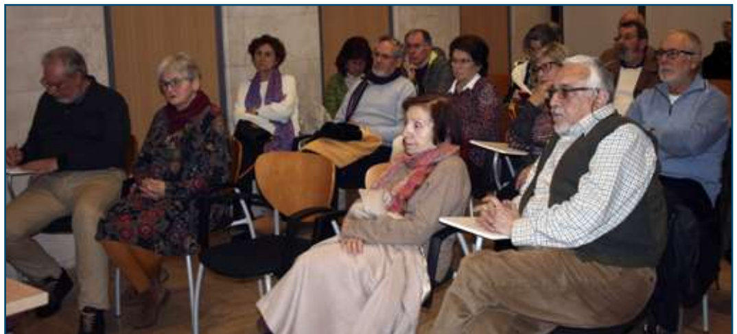
Un moment de la tertúlia a Can Alcover.

La construcció de l'església s'inicia el 1664 —abans s'havia començat un altre que no agradà—, i s'acaba el 4 d'agost de 1689, festa de Sant Domingo. El 1666 es construeix la capella del Roser, al costat esquerre de la façana i, a continuació, es construeix el claustre —començat l'any 1730 i acabat el 1800—. Sant Domingo tampoc quedà al marge de la desamortització de 1835, i els dominics abandonen per sempre el seu convent inquer, passant aquest a dependre de l'Estat. El 1843 l'ajuntament d'Inca el compra i el 1867 passa a dependre de la parroquial de la ciutat, es començà a tenir cura de l'església i se celebren misses. El 1962 Sant Domingo és erigida parròquia. Després de l'exclaustració, les dependències conventuals, així com el mateix claustre pateixen tota classe de transformacions. Al convent, s'hi instal·la la presó, el jutjat, la caixa de reserva militar, un Institut de Segona Ensenyança i la comandància de la Guàrdia Civil. Fins i tot, està documentat que a durant el segle XIX se celebren curses de braus dins el claustre. Amb el pas del temps, tant les dependències del convent com el mateix claustre es van degradant fins a arribar al punt que als anys noranta es declara l'estat ruïnós de l'edifici i s'elabora un projecte de rehabilitació per convertir-lo en un centre cultural. El 2003 s'acaben les obres i les noves dependències de l'antic convent i claustre de Sant Domingo, sent inaugurades el 23 d'abril de 2003.