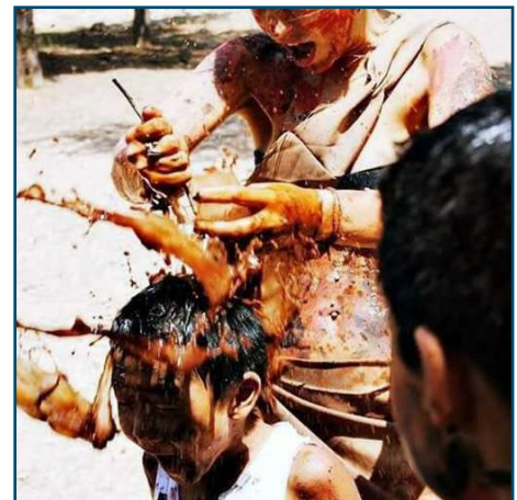
Fotografia guanyadora del concurs de l'any 2015.

La fotografia guanyadora sortirà a alguna publicació del Moviment Escolta i Guiatge de Mallorca