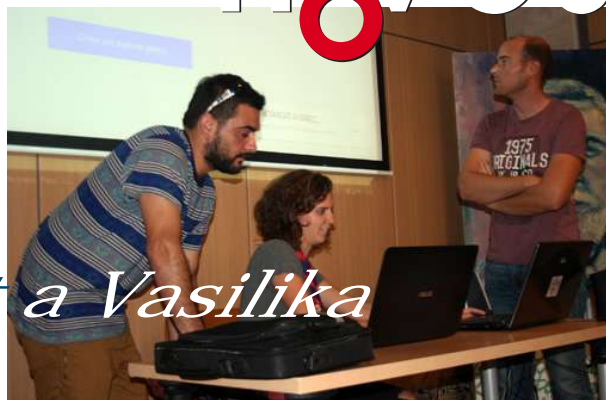
Preparant la presentació.

En aquest context, el grup mallorquí ha participat en aquest projecte en dues etapes, una durant els mesos de març i abril, i una segona en el mes de setembre, aquesta darrera vegada el grup ha sigut més nombrós, però no tots han participat els mateixos dies, s'han anat incorporant i abandonant el camp